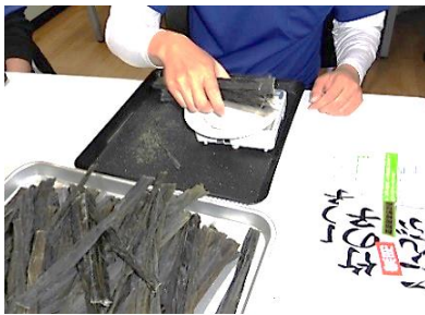
こんぶ かこうぎょうむ 昆布の加工業務