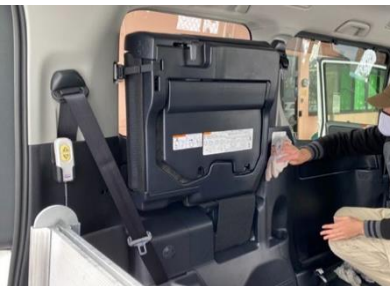
せいそうぎょうむ 清掃業務