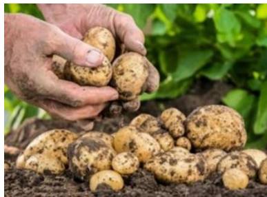
やさい 野菜づくり